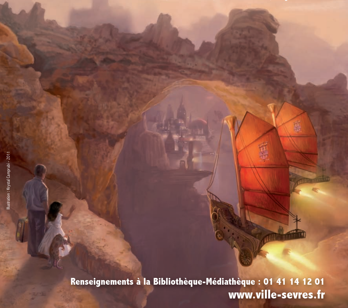
Illustration : Krystal Camprubi - 2011

Rencontres, dédicaces, conférences, expositions